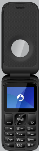
POSITIVO FLIP (P40)